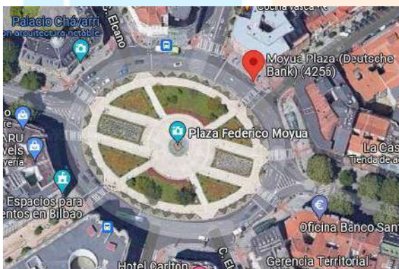
BILBAO (Plaza Moyua)